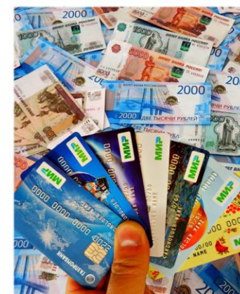
Страхование и финансы