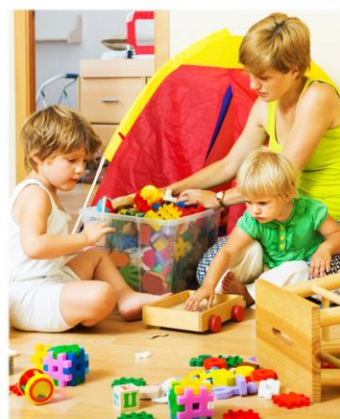
Семья и дети