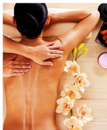
Красота и здоровье