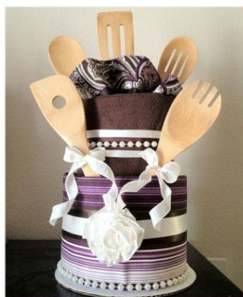
Украшения и подарки