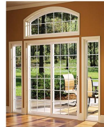
Окна и двери