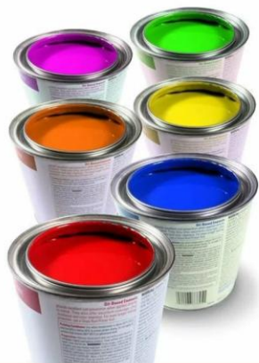
Краски и эмали