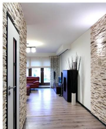
Декор и отделка