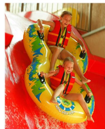
Развлечения и отдых